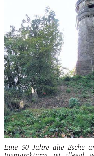
Eine 50 Jahre alte Esche am Bismarckturm ist illegal gefällt worden.

FRÖNDENBERG ■ Die Empörung ist groß: Nach dem Tauziehen um die Fällung von sichraubenden Bäumen am Bismarckturm kreiste in den vergangenen Tagen noch einmal die Säge - diesmal illegal. Das Opfer: eine 50 Jahre alte und 22 Meter hohe Esche.